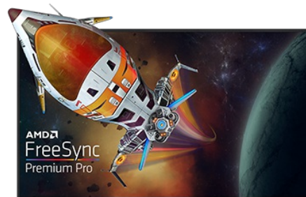
Freesync™ Premium Pro Technology

Tento monitor podporuje obsah HDR s ostrou barvou a jasem. Nízká vstupní latence a nízká kompenzace snímkování ukončily jakékoli problémy s trháním nebo kockáním prakticky při každém snímkování.